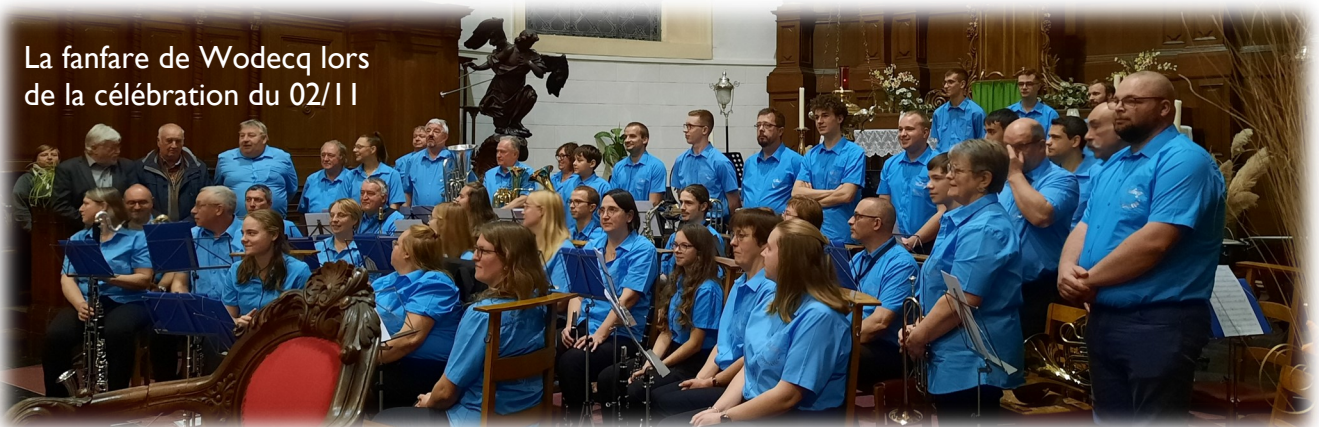
La fanfare de Wodecq lors de la célébration du 02/11

Un verre de l'amitié a été partagé entre choristes et les personnes présentes à l'issue de la célébration".