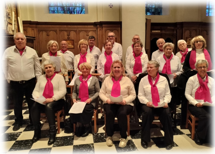
" La chorale d'Hacquegnies et d'Herquegies a célébré sainte Cécile lors de la messe du 23 novembre 2024.

Un verre de l'amitié a été partagé entre choristes et les personnes présentes à l'issue de la célébration".