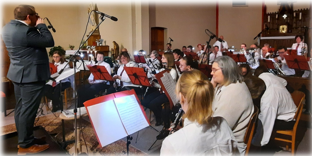
"Les amis réunis" d'Ellezelles Lors de la célébration du 09/11 en l'église du Grand-Monchaut.