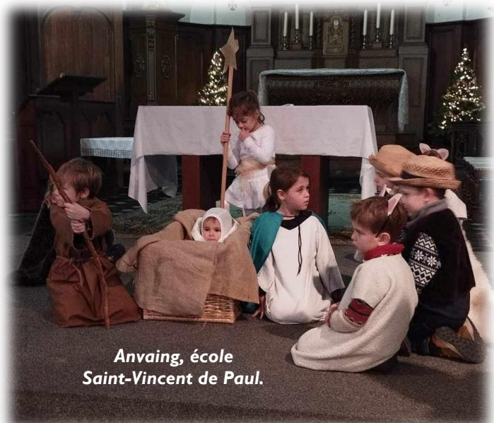
Anvaing, école Saint-Vincent de Paul.