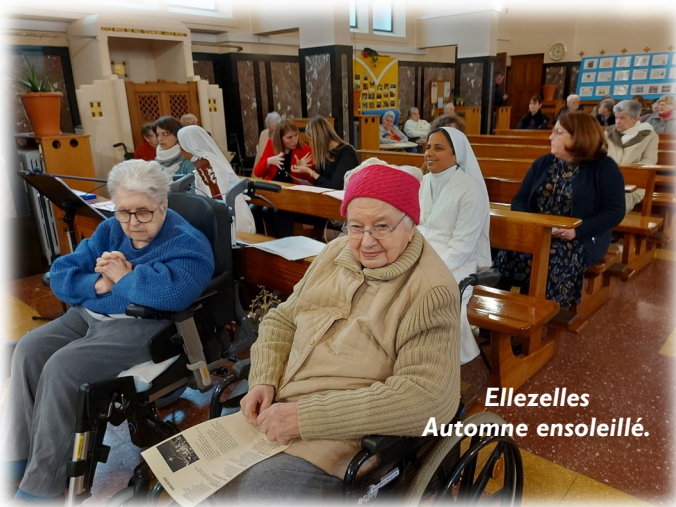
Ellezelles Automne ensoleillé.

Tous sont repartis avec des étoiles plein les yeux et le visage éclairé d'un large sourire !