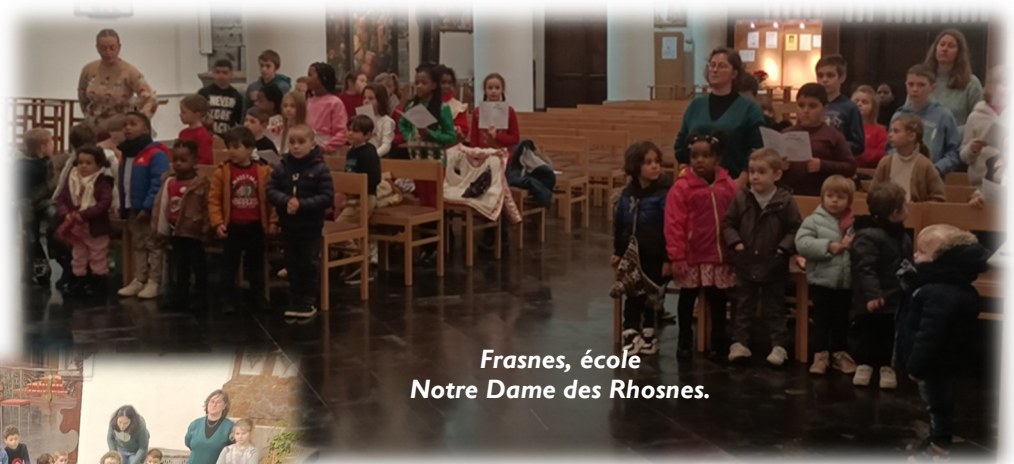
Frasnes, école Notre Dame des Rhosnes.