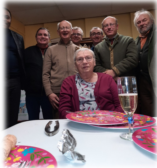
Ellezelles, goûter de Noël de l'association du feuillet