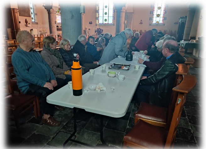
Groupe du chapelet moment de convivialité le 22