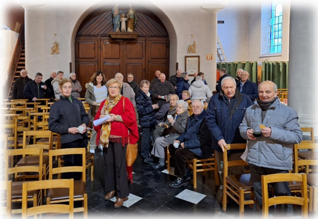
Paroisse de Dergneau

Petit moment de convivialité et de partage autour d'un café après la cérémonie du 21 janvier à l'occasion de la nouvelle année .