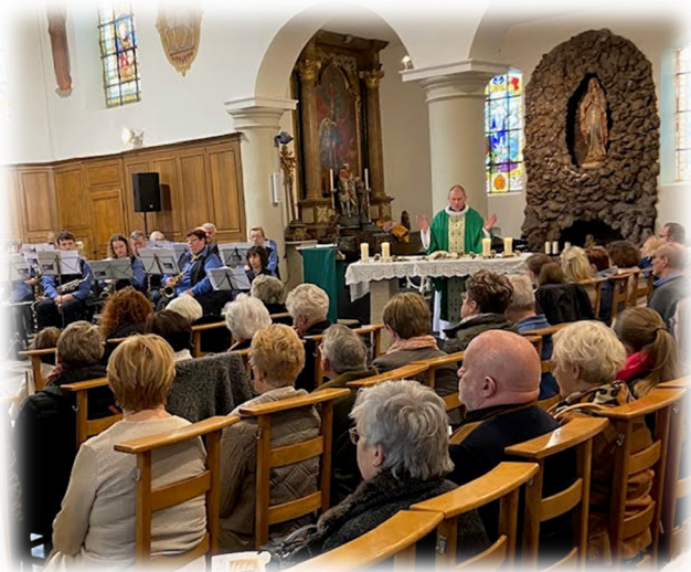
Arc le 4 février Célébration de la sainte Cécile de la Royale fanfare « Les Bons Amis » d'Arc.