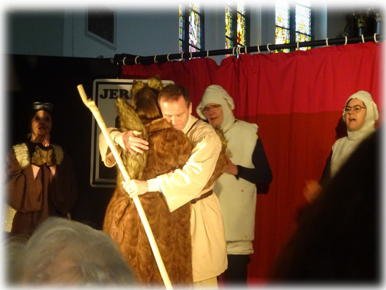
La conversion de Zachée le chef des collecteurs d'impôts, (St Luc 19, 1-10 )