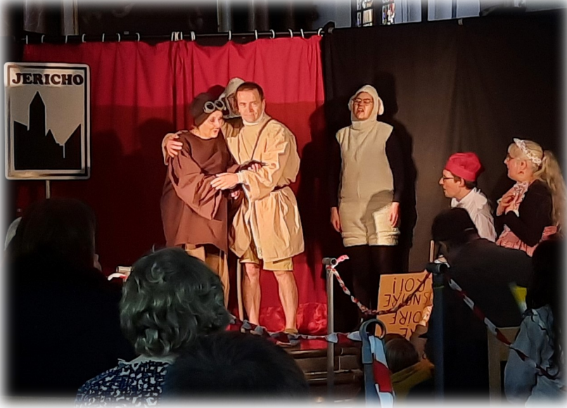
La guérison de Bartimée, l'aveugle de Jéricho (St Mc 10,46-52)