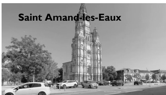
Tour abbatiale située là où saint Amand a vécu et est décédé.