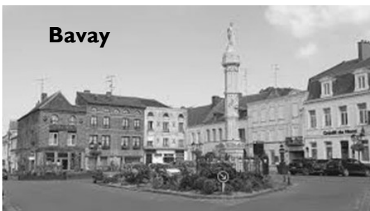
Colonne d'où partent les 7 chaussées romaines dont la chaussée Brunehaut.