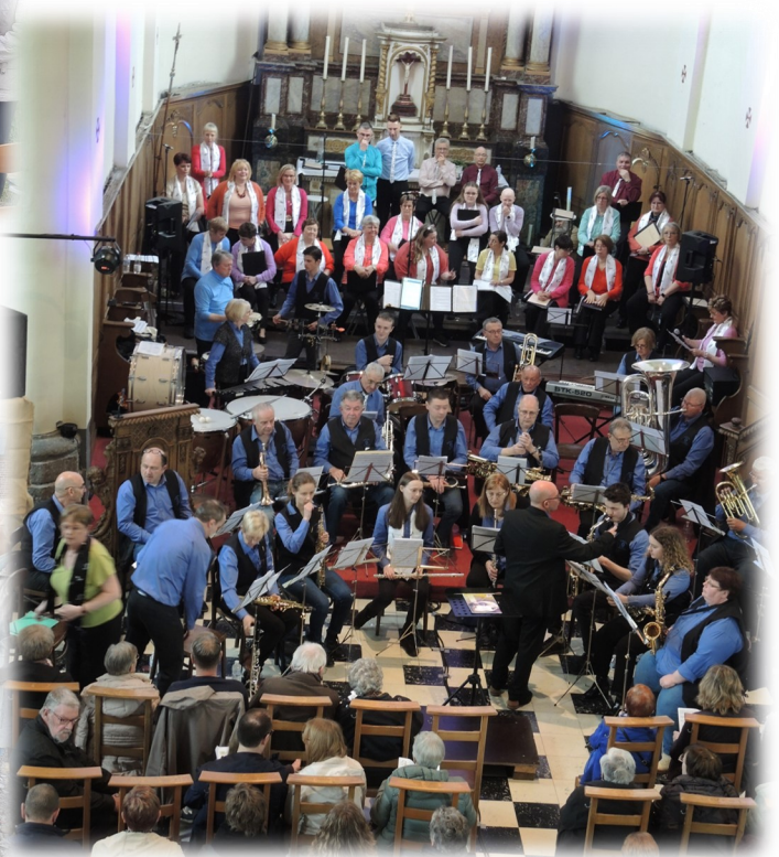
Hacquegnies 20 avril, Chorale "ProMusica" de Dergneau fête ses 45 ans accompagnée de la fanfare "Les bons amis" de Arc.