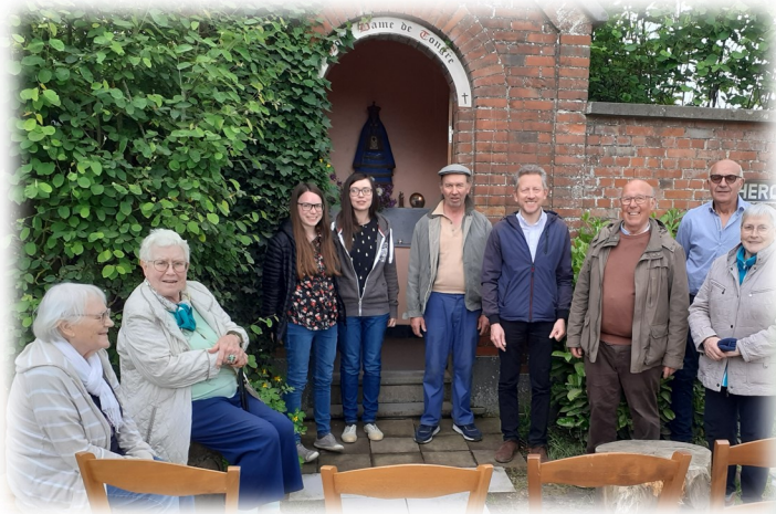
Mois de mai, récitation du chapelet, à la chapelle ND de Tongre à Haut-Doux et à la chapelle de ND de Lourdes à Blancs Arbres