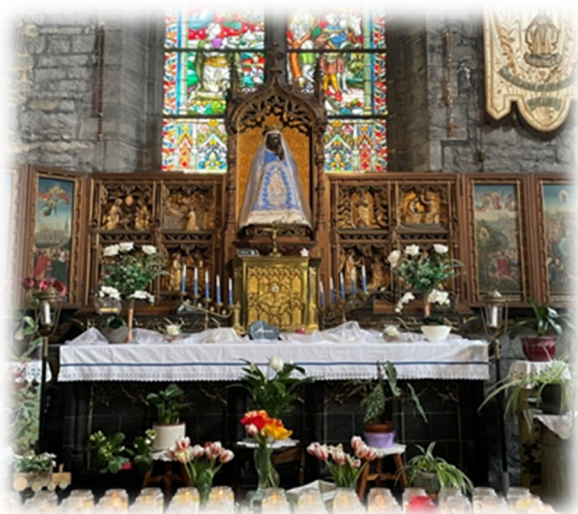
Notre-Dame de Walcourt