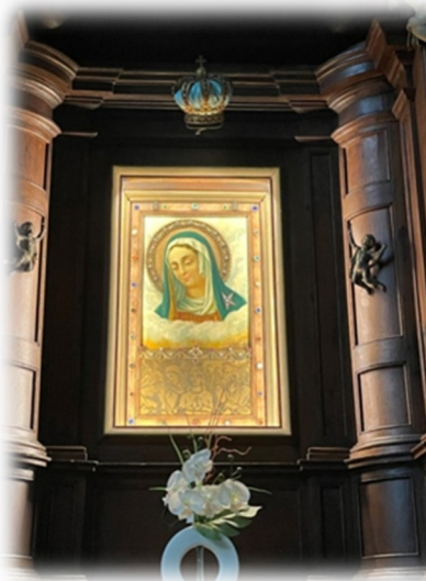
Notre-Dame de Grâce à Berzée